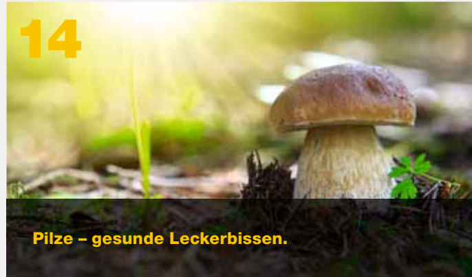
Pilze – gesunde Leckerbissen.