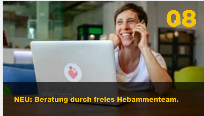
NEU: Beratung durch freies Hebammenteam.