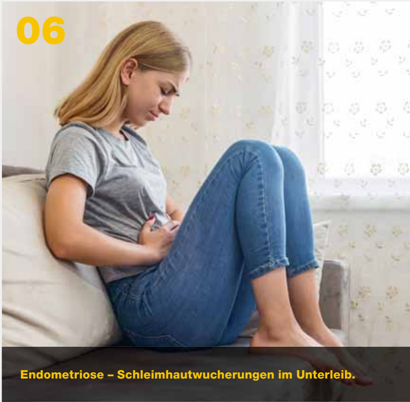
Endometriose – Schleimhautwucherungen im Unterleib.