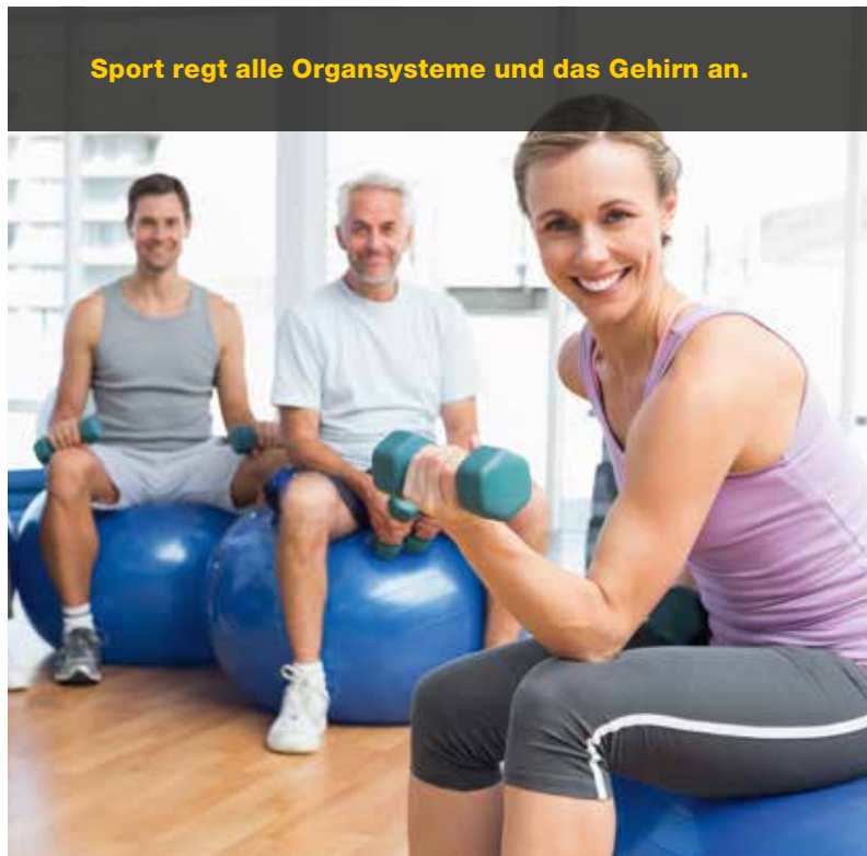
Sport regt alle Organsysteme und das Gehirn an.

Krebspatienten wurde lange geraten, sich körperlich zu schonen. Doch zahlreiche klinische Studien belegen längst das Gegenteil: Körperliche Aktivität wirkt bei Menschen mit Krebs wie Medizin – nur ohne Nebenwirkungen.